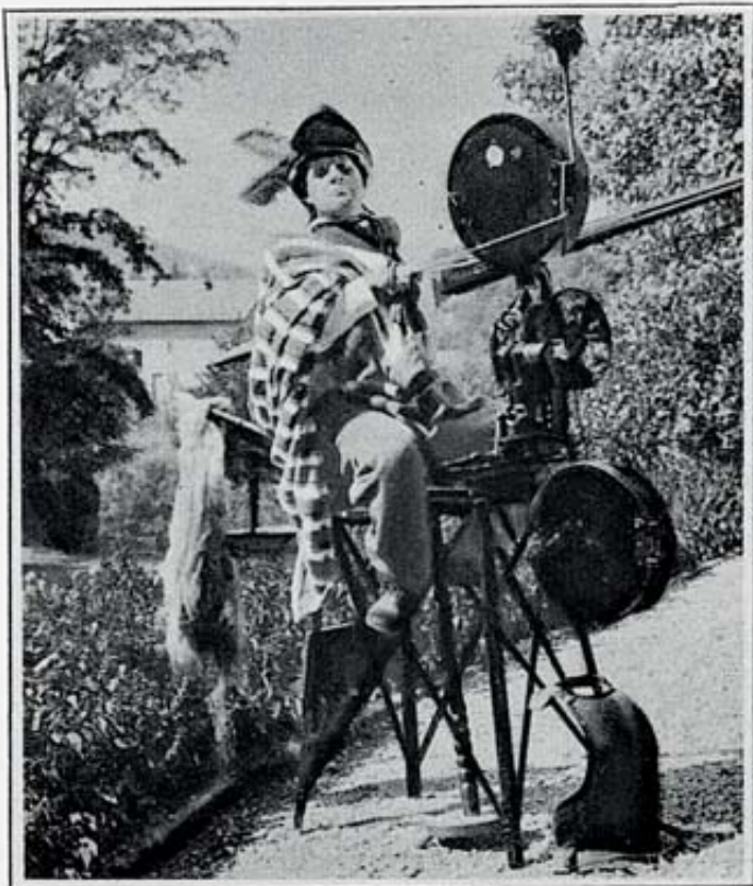
Un metteur en scène russe à La Sarraz.